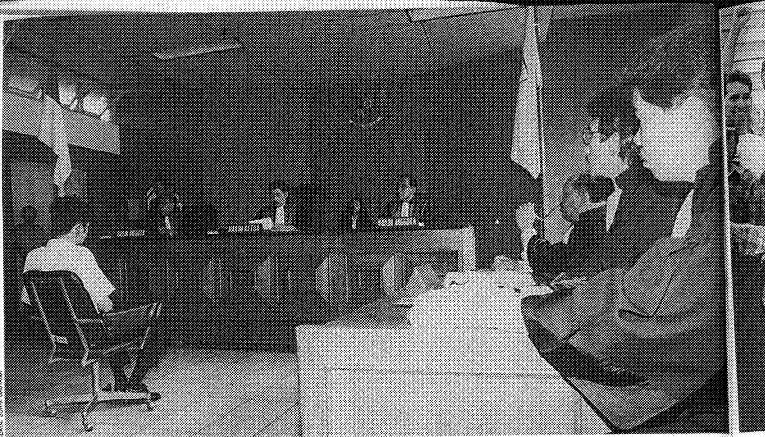
PENGADILAN PRD. Dinyatakan sebagai organisasi terlarang.